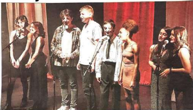
Les huit adolescents ont démontré de bien belles qualités sous le feu des projecteurs du foyer Georges-Brassens.