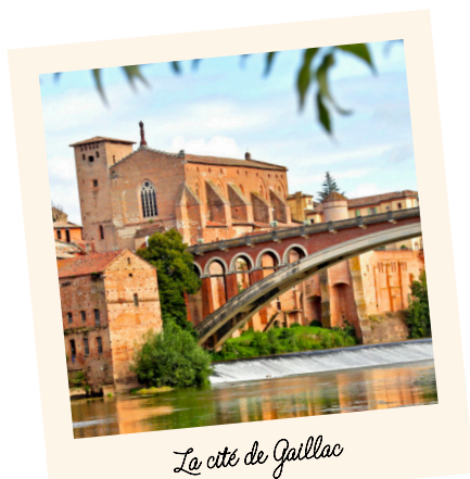
La cité de Gaillac

Petit-déjeuner à l'hôtel. Rendez-vous avec votre guide pour une excursion de la journée. Berceau du vignoble, GAILLAC est la deuxième ville de l'Albigeois. Elle doit son développement au pastel, au vin et au commerce fluvial. Elle fut le théâtre de la croisade des Albigeois, de la guerre de 100 ans et des guerres de religion.