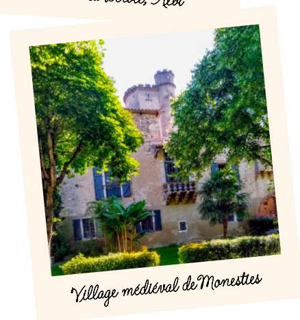
Village médiéval de Monesties